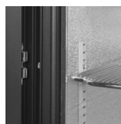
Zarážka dveří pro bezpečnou nakládku