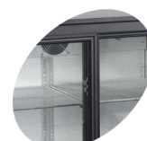
Zarážka dveří pro bezpečnou nakládku